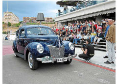
Auch dieser Ford Mercury aus dem Jahr 1940 bekam beim „Concours d'Elegance“ eine Auszeichnung und viel Applaus.