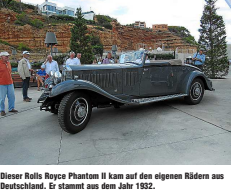
Dieser Rolls Royce Phantom II kam auf den eigenen Rädern aus Deutschland. Er stammt aus dem Jahr 1932.