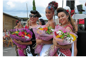
Wie sind die Plätze der Pin-up-Wahl des American Car Clubs Mallorca?