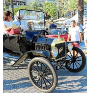
Der älteste Teilnehmer konnte sich bemerkbar machen (r.): Dieses Ford Model T stammt von 1912.