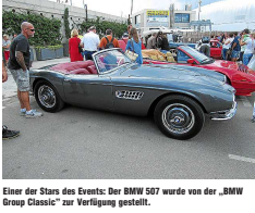
Einer der Stars des Events: Der BMW 507 wurde von der „BMW Group Classic“ zur Verfügung gestellt.