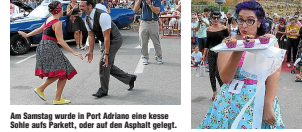
Ein Türchen gefällig?