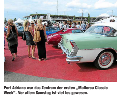
Port Adriano war das Zentrum der ersten „Mallorca Classic Week“. Vor allem Samstag ist viel los gewesen.