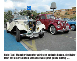
Hallo Taxi! Mancher Besucher wird sich gedacht haben, die Heimfahrt mit einer solchen Droschke wäre jetzt genau richtig ...