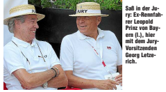
Saß in der Jury: Ex-Baustadler Prinz von Bayern (l.), hier mit dem Jury-Vorsitzenden (oben) Letzter.