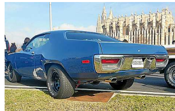
Auch ein Hingucker: Plymouth Satellite Sebring, 1972.