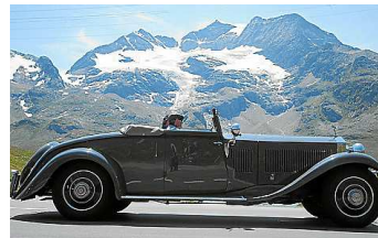
Dieser Rolls Royce Phantom II stammt aus dem Jahr 1932.