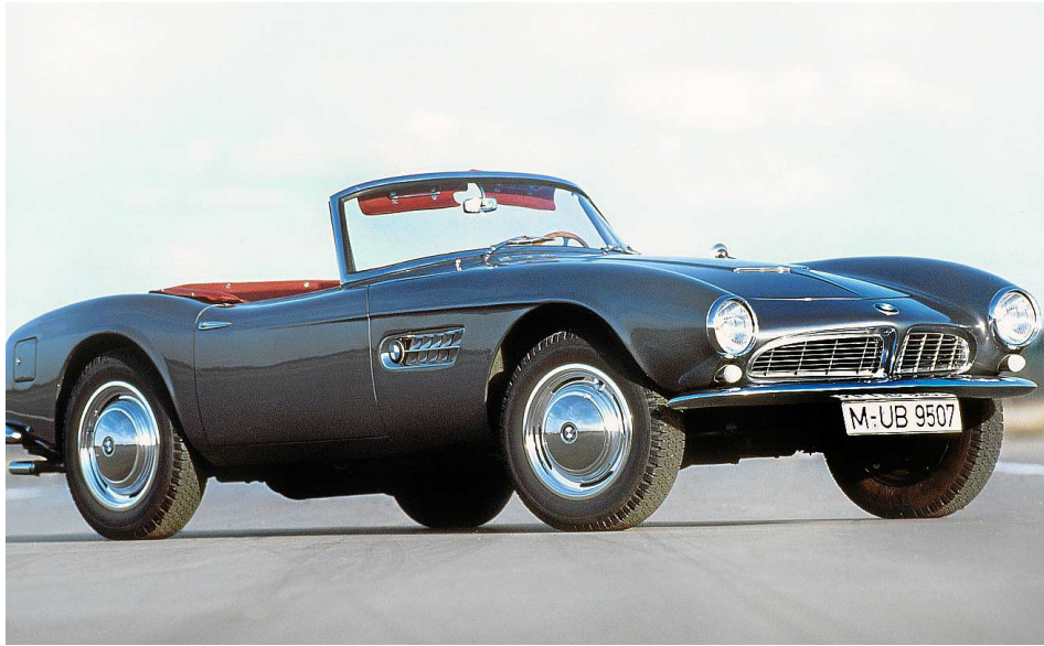
Einer der Stars des Events: Der BMW 507 ist Eigentum von BMW.

Der anthrazitfarbene BMW 507, der in Port Adriano zu sehen ist, war ursprünglich wie der von Elvis federweiß und wurde am 2. September 1957 ins