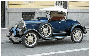
Etwas für Nostalgiker: ein Ford Model A aus dem Jahr 1929.