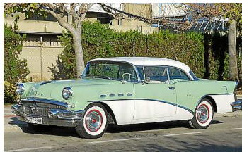
Schnittiger Ami-Schlitten: Der Buick Century wurde 1956 gebaut.